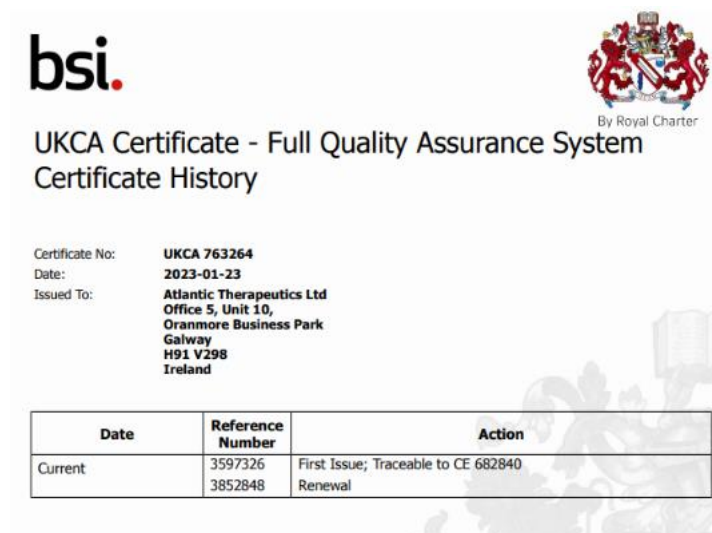
Figure 1 Excepté le certificat UKCA 763264 avec le renouvellement du dossier technique de la marque CE en vertu de la directive 93/42/CEE.

Tous les produits actuellement sur le marché et détenus par les distributeurs français ont été fabriqués et approuvés par AT avant la date d'expiration du marquage CE du 24 janvier 2023 sous une déclaration de conformité et un certificat de marquage CE valides.